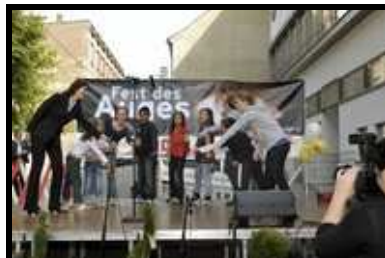
Kinderdarbietung des Hortes Lortzinggasse