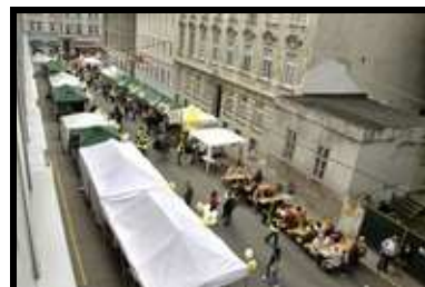
Die Feststände aus der Vogelperspektive