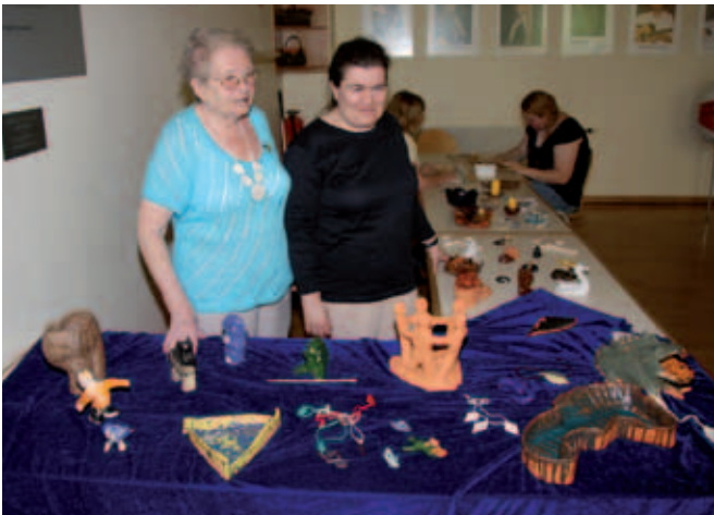
Immer wieder neue ...