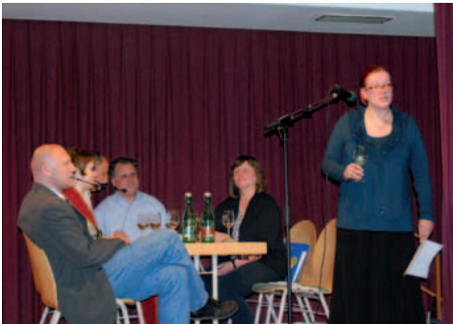
Werder's wissenswerte Weinwürdigung