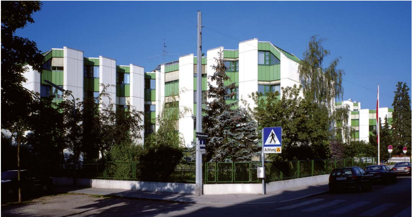
Das Johann-Wilhelm-Klein-Haus – ein Blindenwohnheim, in dem Freiheit und Selbstständigkeit gelebt und gefördert werden