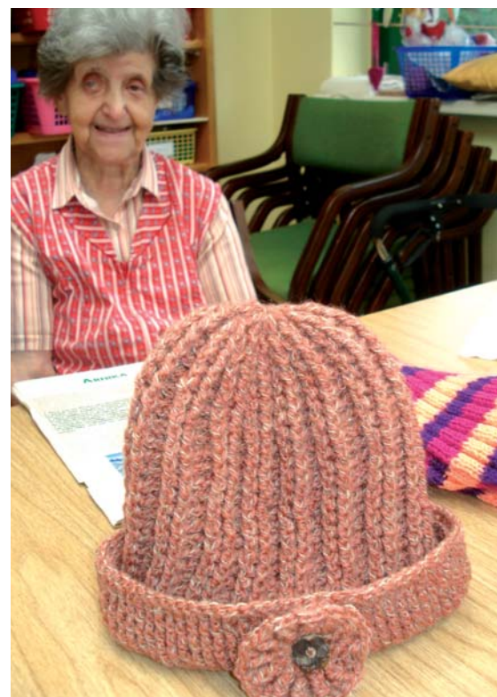
Eine warme Winterhaube, mit viel Liebe von einer sehbehinderten Frau gestrickt

alleine in die Oper fährt. Die U4 (ganz in der Nähe des Heimes und barrierefrei zu erreichen) bringt ihn direkt und problemlos zur Oper.