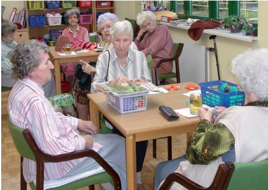
Die Damen in der Kreativstube sind fleißig am Stricken für den Weihnachtsmarkt

lung mit 40 Betten. Die Reinigung des Apartments ist in den Kosten genauso inkludiert wie die täglichen Mahlzeiten, die Betreuung, das Mobilitätstraining und die Physiotherapie sowie das Service der Hausschwester (Medikamente, Augentropfen ...).